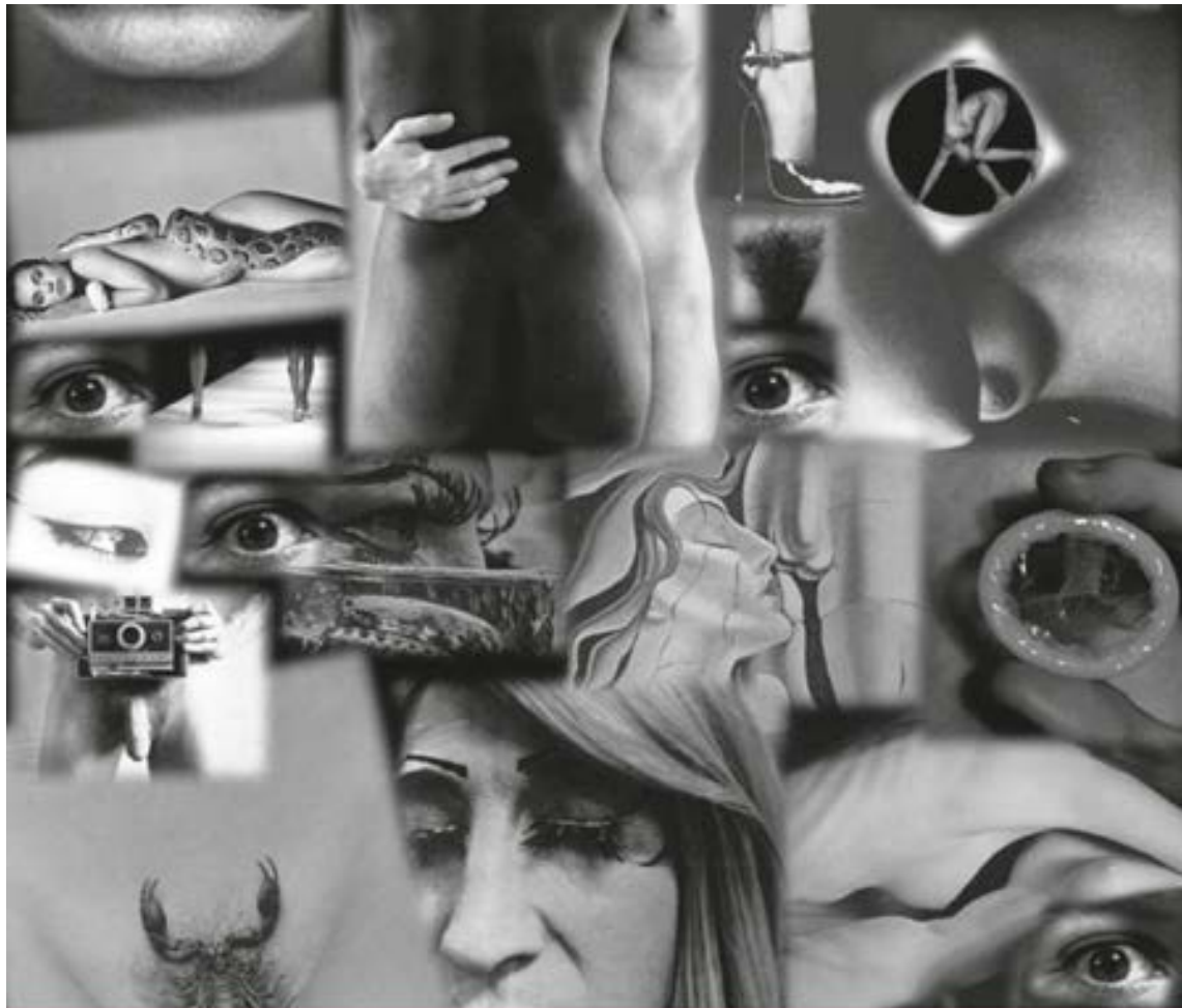
IMAGEN: SANDRA NICOSIA